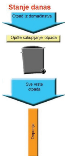
Slika 2: Upravljanje čvrstim otpadom u Federaciji BiH danas

Iz tog razloga ministarstvo je odredilo prioritete u upravljanju ambalažom i ambalažnim otpadom radi osiguranja instrumenata za provođenje strategije i politike upravljanja otpadom.